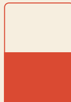
Ilmoitus 1/2 sivu 550,00 € 210mmX148mm

Julkaisu ilmestyy myös verkossa: artteli.fi/järjestöjulkaisu